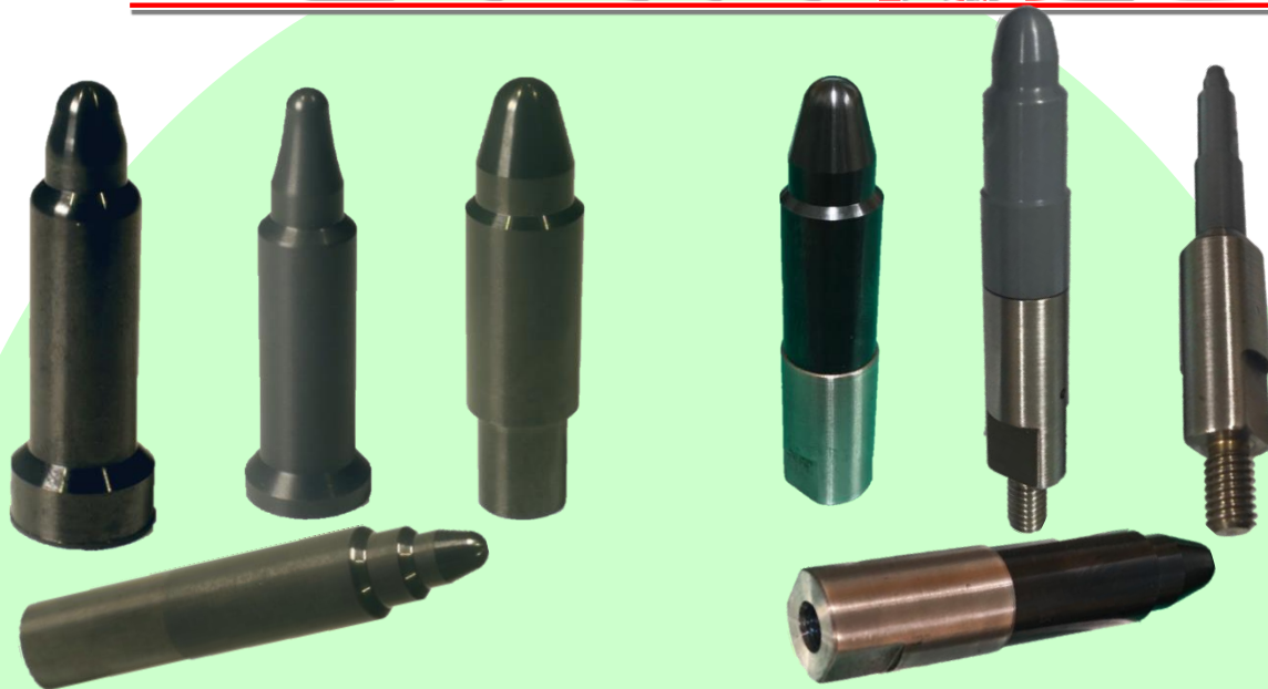
セラミックガイドピン